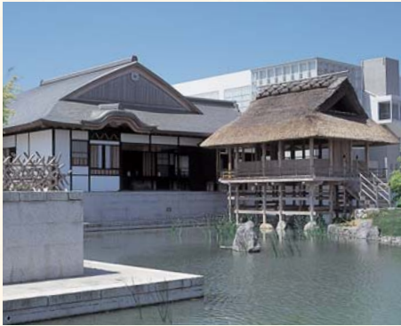
在茶室里体会日本茶的世界。 茶之乡