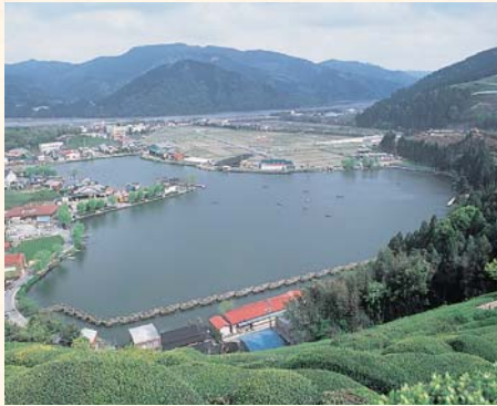
漫步在野守公园，心旷神怡。 野守池