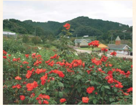
一览珍品玫瑰的风采。 玫瑰丘公园