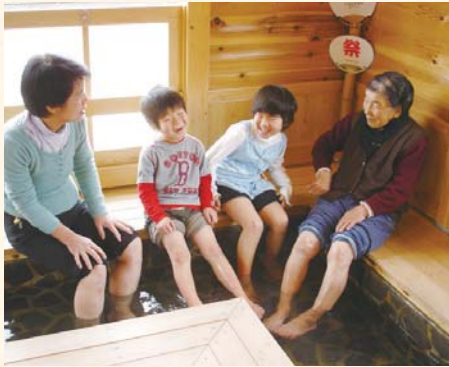
紧邻家山站的足浴小屋。 家山足浴场