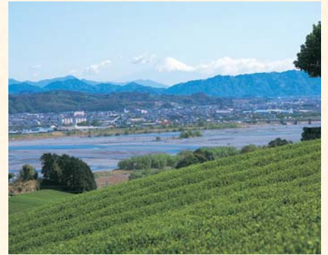
富士山和大井川的景色尽收眼底。 牧之原大茶园