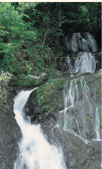
落差达10米的 连续八个瀑布。 八垂瀑布