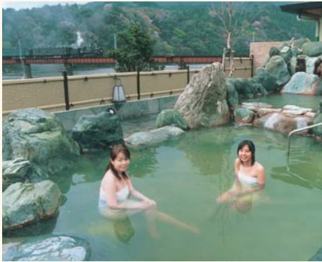
远眺SL(蒸汽机车)驶过的温泉设施。 川根温泉