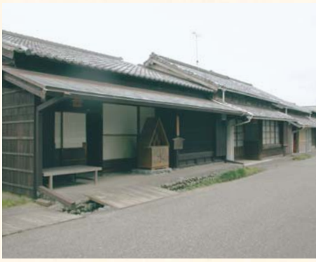
可以体会到旧时的风貌。 大井川渡船遗迹